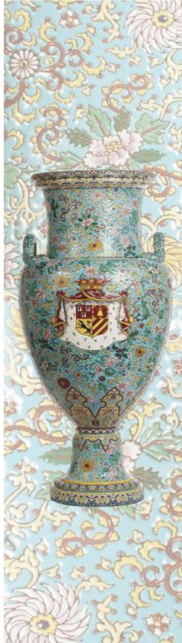
Amphore armoriée à décor de pivoines, signée Clément Massier, datée 1887, faïence aux émaux cernés, H : 155cm.